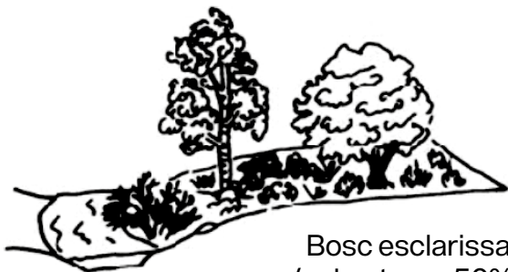
Bosc esclarissat (cobertura <50%)